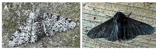
Figure 1. Mélanisme industriel de la phalène du bouleau. Ce papillon nocturne passe la journée immobile sur les troncs de bouleau, invisible aux oiseaux prédateurs (A, forme blanche typica). La forme noire, carbonaria (B), est devenue majoritaire dans les zones polluées après la révolution industrielle au 19 ème siècle.

Les différents individus d'une même espèce peuvent rencontrer des conditions environnementales très variables. Ainsi, une plante poussant en plaine ne subit pas les mêmes contraintes climatiques qu'une plante poussant en montagne. De même, un animal vivant en zone urbaine, agricole ou en forêt n'aura pas accès aux mêmes ressources et ne sera pas exposé aux mêmes polluants... On parle alors de contraintes abiotiques, par opposition aux contraintes biotiques, liées aux interactions entre organismes vivants. Les contraintes environnementales étant localement variables, des individus présentant des traits différents vont être sélectionnés localement. Un trait adaptatif est une caractéristique morphologique, physiologique, ou comportementale, qui procure un avantage de survie ou de reproduction aux individus qui présentent ce caractère, dans un environnement donné. Cependant, tous les traits variables dans l'espace ne sont pas nécessairement adaptatifs.