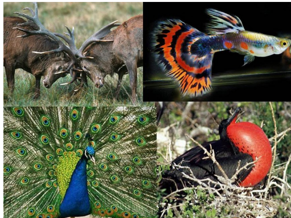
Figure 5. Les caractères sexuels extravagants peuvent être impliqués dans la compétition entre mâles pour l'accès aux femelles, comme les bois démesurés des cerfs, ou dans le choix des femelles, comme les couleurs exubérantes des guppies, paons ou frégates.

L'évolution de certains traits extravagants comme la queue démesurée des paons ou la couleur vive des guppies peut sembler difficile à expliquer car ils semblent plutôt défavorables en terme de survie (plus visibles par les prédateurs, encombrants...) ; pourtant ces traits sexuels coûteux en terme de survie sont sélectionnés chez les mâles car ils permettent un meilleur accès aux femelles, par compétition directe entre mâles, ou parce que les femelles choisissent les mâles qui présentent ces traits pour s'accoupler (Figure 5). C'est la sélection sexuelle [6].