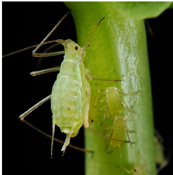
Figure 6. Chez le puceron du pois Acyrtosiphon pisum la capacité de survivre sur une plante-hôte (trèfle ou luzerne) est conférée par des bactéries symbiotiques différentes. L'adaptation à une plante-hôte donnée n'est pas le résultat d'un tri sur les gènes du puceron, mais d'un tri sur les bactéries qu'il héberge. Les bactéries ayant un taux de reproduction plus élevé que le puceron, ce mécanisme d'adaptation via le partenaire associé pourrait être une façon très efficace pour les organismes de répondre rapidement à un changement environnemental brutal (e.g., rotation de cultures...). De plus la couleur des individus est conférée par des bactéries symbiotiques qui produisent le pigment vert, assurant une meilleure protection contre les prédateurs (coccinelles) par camouflage (voir réf. [7]).

Ces dernières années, une nouvelle vision des processus évolutifs est apparue : elle intègre la coopération (interaction à bénéfices réciproques) entre organismes au même niveau que la compétition pour la survie. Cette vision est née de la prise en compte des conséquences de l'incroyable diversité des microorganismes symbiotiques présents dans les organes et les cellules de tous les organismes. Les mycorhizes des plantes, bactéries intestinales, bactéries endocellulaires des insectes, Figure 6 [7]), ou microbiote , jouent un rôle majeur dans un grand nombre de fonctions vitales : nutrition, détoxification, réponse immunitaire, comportement, et même reproduction. Certains auteurs appellent même à formuler une nouvelle théorie synthétique de l'évolution où la cible de la sélection naturelle ne serait plus l'organisme seul, mais l'ensemble organisme et microbiote, appelé 'holobionte' [8] (lire Systèmes symbiotiques et parasites ).