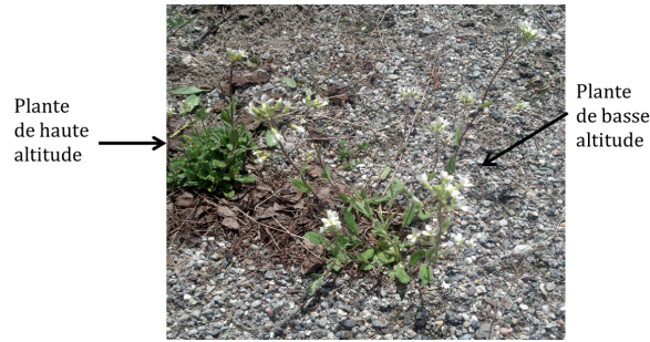
Figure 3. Ces deux plantes de la même espèce Arabis alpina sont issues de graines prélevées sur une plante mère poussant à 3000 m (plante de gauche) ou à 1000 m (plante de droite). Elles présentent des morphologies bien différentes : port compact, petites fleurs peu nombreuses pour la première, et un port plus lâche, des fleurs plus hautes et plus nombreuses pour la seconde. Elles sont pourtant cultivées dans les mêmes conditions (jardin alpin du Lautaret, 2000 m d'altitude). La mesure de ces traits in situ (c'est-à-dire où les graines avaient été prélevées), et en jardin commun (là où l'expérience est réalisée) permet de distinguer la part de l'environnement et de la génétique dans leur expression. La mesure de la survie et de la reproduction d'individus transplantés in situ par rapport aux individus vivant dans les conditions initiales permet de montrer le caractère adaptatif de ces traits en lien avec l'altitude.

Dans les populations naturelles, la plupart des traits ne sont pas des caractères discrets (blanc/noir) codés par un seul gène. Le poids, la forme, ou la taille sont des traits qui varient de façon continue dans les populations : ce sont des caractères quantitatifs (polygéniques) ; de plus, l'expression de ces caractères est dépendante de l'environnement : une plante bien arrosée et fertilisée va atteindre une taille plus importante que si elle est plantée dans un milieu aride et peu fertile, indépendamment des gènes qu'elle porte. Cette capacité des organismes à ajuster leurs traits aux ressources disponibles dans l'environnement rencontré est nommée plasticité phénotypique . La valeur d'un trait mesuré en population naturelle ( phénotype ) dépend pour partie des gènes de l'individu, et pour partie de l'environnement dans lequel cet individu se développe.