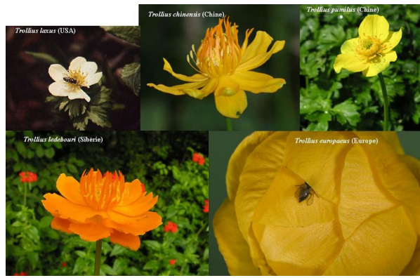
Figure 4. La diversité des corolles (forme, odeur, couleur) observée entre espèces proches et interfécondes du genre Trollius résulte de l'interaction avec différents cortèges de pollinisateurs chez cette plante arctico-alpine d'origine Himalayenne.

Au-delà des conditions environnementales abiotiques rencontrées (climat, polluant), tout individu est la proie et/ou le prédateur d'au moins une autre espèce : l'environnement d'un organisme, c'est avant tout les autres ! Les interactions avec d'autres espèces (lire Symbiose et parasitisme ) : prédateurs, parasites, compétiteurs mais aussi mutualistes (e.g. pollinisateurs, Figure 4) constitueraient l'essentiel des facteurs sélectifs façonnant les traits adaptatifs dans les populations selon l'hypothèse "de la reine rouge" [5]. Selon l'hypothèse alternative dite "du fou du roi" les facteurs abiotiques (chutes de météorites, volcanisme, changements climatiques) joueraient un rôle prépondérant dans l'évolution de la biodiversité. Les deux mécanismes sont vraisemblablement en jeu dans l'évolution des populations et des espèces, l'évolution des clades ( macroévolution ) procédant par changements graduels (rythme « reine rouge ») avec parfois des événements de spéciation très rapide en lien avec des changements brutaux de l'environnement (« fou du roi »).