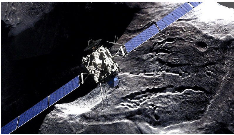
Figure 1. La sonde Rosetta survolant la comète 67P/Churyumov-Gerasimenko, familièrement appelée « Tchoury ». Image issue du film "Chasing A Comet – The Rosetta Mission"

La planète Terre était, lors de sa formation, initialement anhydre ou pauvre en eau, celle-ci s'étant accumulée dans les planètes Joviennes, plus loin du soleil, et dans les ceintures de comètes (nuage de Oort et ceinture de Kuiper) ; la Terre a reçu l'essentiel de son eau au cours des premières centaines de millions d'années de son existence, et est proportionnellement la plus riche en eau des planètes telluriques (Mercure, Vénus, Terre et Mars). Une origine cométaire de cette eau , initialement favorisée, est aujourd'hui sérieusement mise en doute, en particulier depuis la mission Rosetta de l'Agence spatiale européenne, qui a envoyé le 12 Novembre 2014 la sonde Philae (voir Figure 1) se poser sur la comète 67P/Churyumov-Gerasimenko et mesurer en particulier la teneur en Deutérium de sa glace : deux fois plus riche en cet isotope de l'hydrogène que l'eau de la Terre ; ce type de comètes (au moins) ne peut donc pas être à l'origine de l'eau terrestre, les regards se tournent plutôt vers un bombardement par des astéroïdes rocheux ou ferreux contenant aussi un peu d'eau.