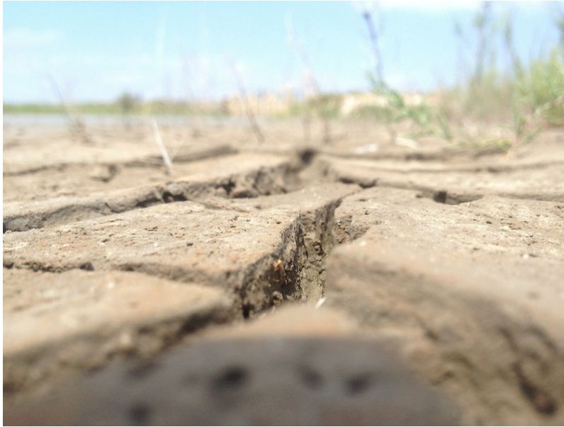
Figure 5. Formation de terres arides, voire désertiques et raréfaction de la couverture végétale.

environnementales délétères , mais si la population de la planète ne cesse d'augmenter, ne faut-il pas tenter de la nourrir, et ce de la façon la moins néfaste possible ? Le dessalement de l'eau de mer a un coût de l'ordre de 0,7 €/m 3 , et une consommation électrique de 2 à 4 kWh/m 3 : c'est environ dix fois trop pour de l'eau d'irrigation, mais acceptable pour l'eau domestique.