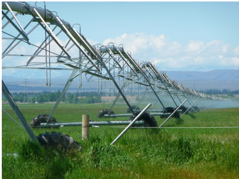
Figure 3. Exemple d'un moyen d'irrigation à grande échelle sur des parcelles de maïs, qui consomment une quantité d'eau importante.

Pour l'eau industrielle , nous utilisons chacun environ 1 300 m 3 /an. Mais cette eau n'est consommée qu'à 10% ; elle est rejetée à 90% dans le milieu, parfois réchauffée (eau de refroidissement) ou polluée, si elle n'est pas traitée.