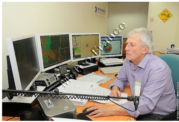
Figure 4. Joël Collado, prévisionniste de Météo France, une voix emblématique sur les ondes de Radio France de 1994 à 2015.

En France, l'assistance au tournoi de tennis de Roland Garros en est un exemple historique emblématique. Ce type de prestations s'est depuis généralisé. On parle de routage météorologique pour les courses à la voile en mer, ou les expéditions en montagne [8]. Le facteur météorologique peut s'avérer déterminant pour la réussite d'une entreprise. Citons par exemple le projet PlanetSolar , premier tour du monde en bateau alimenté uniquement par énergie solaire en 2010-2012. Cette aventure a mobilisé des prévisionnistes de la division Marine de Météo France. Ceux-ci ont d'abord réalisé une expertise en amont, de type climatologique, permettant de déterminer la meilleure voie maritime à suivre a priori , grâce à l'étude des observations et des données numériques disponibles sur les vents, l'ensoleillement, les courants marins superficiels, les vagues. Ensuite, en temps réel, ils ont assisté le navire, pendant son périple autour du globe, qui dura 18 mois. Ils ont fourni des prévisions quotidiennes, et assuré un suivi continu de la situation, afin que le bateau évite tempêtes et zones nuageuses.