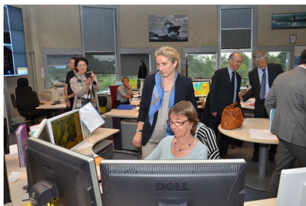
Figure 1. Visite de Madame Delphine Batho, Ministre de l'Ecologie, du Développement durable et de l'Energie, au Centre National de Prévision (CNP) de Météo France à Toulouse en 2013.

international [1] au sein de l'Observatoire de Paris en 1856 et de la mise en place du dispositif de vigilance météorologique [2] en 2001.