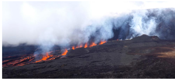
Figure 1. Un exemple de fracturation hydraulique naturelle : la première phase d'une éruption basaltique au Piton de la Fournaise (île de la Réunion).

En résumé on peut dire qu'un fluide au repos transmet la pression de la même manière dans toutes les directions, ce qui n'est pas le cas d'un solide au repos. De ce fait les fractures hydrauliques se développent dans le plan perpendiculaire à la direction de la composante principale minimum de la contrainte dans le solide.