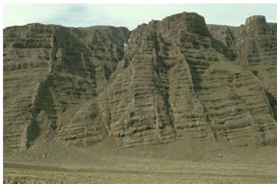
Figure 2. Dykes en Islande : Une fois le magma refroidi, les dykes volcaniques correspondent à de grandes structures planes dont la géométrie témoigne de l'orientation des directions principales locales de la contrainte lors de la mise en place du magma. [Source : photo A. Gudmunsson].

Du fait qu'une fracture hydraulique se propage perpendiculairement à la contrainte principale minimum dans le massif, sa géométrie à grande échelle est contrôlée par celle des variations de contrainte principale minimum dans le massif. Par exemple la figure 2 montre que les dykes volcaniques, une fois le magma refroidi, correspondent à de grandes structures planes qui renseignent sur l'état de contrainte locale.