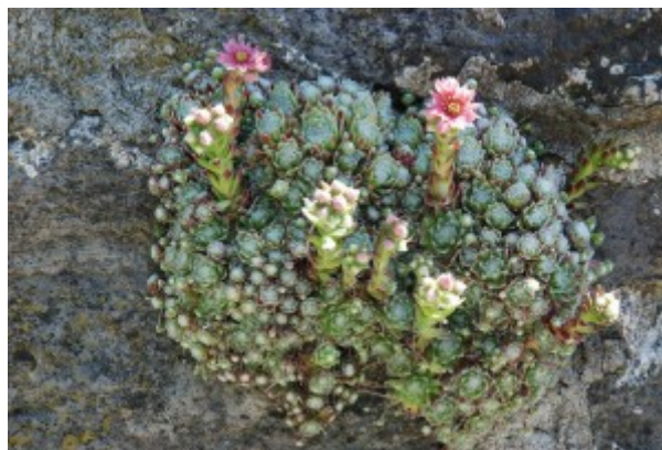
Figure 1. Joubarbe aranéuse ( Sempervivum arachnoideum L.). [Source Photo Jacques Joyard].

Richard Bligny , Ancien Directeur de Recherche CNRS, laboratoire de Physiologie Cellulaire et Végétale, Université Grenoble Alpes