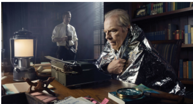
Figure 2. Personnage souffrant d'une EHS dans la série TV « Better Call Saul ».

Des entretiens menés avec des personnes se déclarant EHS ont mis en évidence un processus en plusieurs étapes conduisant à la conviction que les ondes sont bien la cause des maux (Figure 2). Les symptômes, parfois préexistants de longue date, trouvent une explication par le biais d'une émission de radio, un article de presse ou une conversation avec des proches relatant des effets néfastes des ondes [12]. L'effet nocebo apparaît alors comme une composante secondaire qui viendrait amplifier le processus.