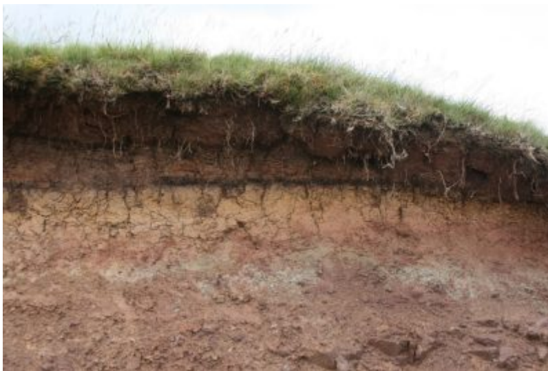
Figure 2. Dans un sol, la majeure partie de la biomasse se trouve dans les \approx 10-20 cm supérieurs, mais la biomasse microbienne est largement présente plus en profondeur.

La litière est composée de matériel végétal mort et en décomposition (principalement des feuilles et des brindilles) qui sont tombés sur le sol (Lire La place des sols dans le cycle du carbone ). En plus de la matière végétale en décomposition, la litière contient des microbes et une faune (procaryotes, protistes, champignons, nématodes, annélides et arthropodes).