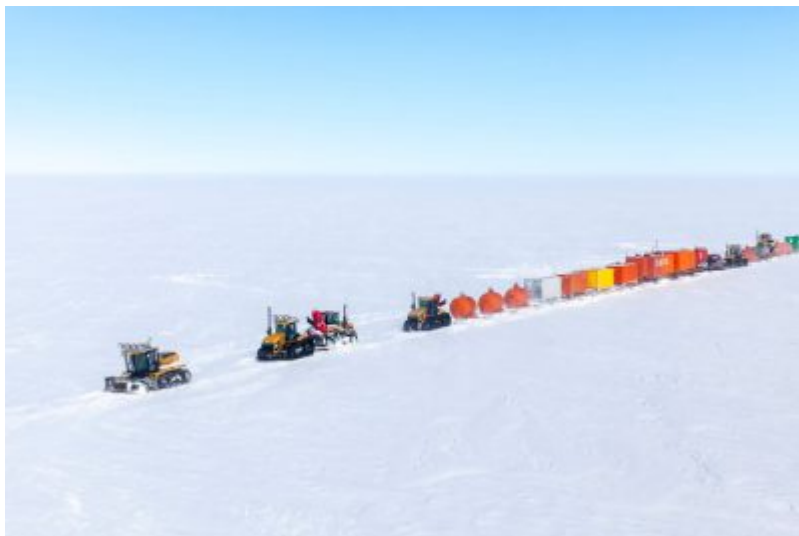
Figure 4. Convoi terrestre reliant la station Robert Guillard, annexe de la station de Dumont d'Urville en Terre Adélie, à Cap Prudhomme, et la station Concordia, distantes de 1100 km. Tout le ravitaillement de Concordia, carburant, nourriture, matériaux de construction, équipements scientifiques, se fait de cette manière, à travers 2 à 3 voyages pendant chaque été austral. Les personnels sont quant à eux transportés par avion.

Ces infrastructures lourdes (stations, navire, convois terrestres, avions, hélicoptères) sont naturellement coûteuses mais sont indispensables pour permettre à la France de participer à l'effort de recherche internationale en Antarctique et de maintenir son rang au sein des pays qui y contribuent le plus largement. Ainsi, la France se situe au 5 e rang des pays publiant sur l'Antarctique ; en Europe, seuls l'Allemagne et le Royaume-Uni se situent devant.