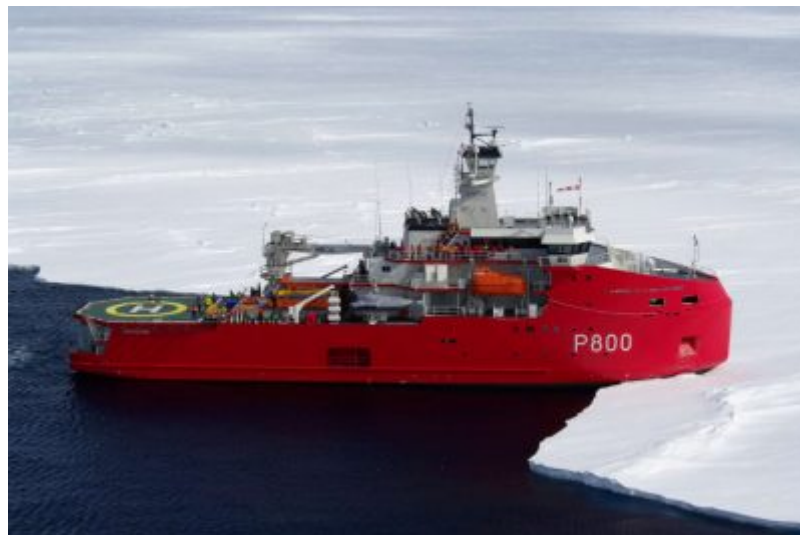
Figure 3. L'Astrolabe, navire brise-glace (IB5) propriété des TAAF, armé par la Marine nationale, et exploité par l'IPEV pendant l'été austral pour la desserte maritime de la Terre Adélie, en vue du ravitaillement des bases Dumont d'Urville et Concordia. Ce navire est sorti des chantiers Piriou à Concarneau en juillet 2017 et a effectué ses premières missions en Antarctique dès novembre de la même année.

Pour ravitailler les deux stations Dumont d'Urville et Concordia, l'IPEV opère, en partenariat avec les TAAF et la Marine nationale, un nouveau brise-glace, L'Astrolabe (Figure 3), qui a effectué ses premiers voyages en Antarctique fin 2017, à partir du port d'Hobart, en Tasmanie (Australie). Ensuite, entre Dumont d'Urville et Concordia, les matériels, carburants et vivres sont acheminés par voie terrestre, au moyen de convois sur glace (Figure 4), fruit du développement et du savoir-faire de l'IPEV qui