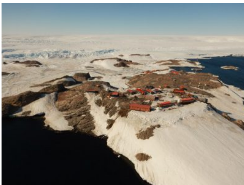
Figure 1. La station française Dumont d'Urville, en Terre Adélie. L'Institut polaire français Paul-Emile Victor (IPEV) y organise la recherche scientifique et, par délégation des Terres Australes et Antarctiques Française, en assure la logistique et la maintenance.

La France dispose de deux stations de recherche en Antarctique : la station Dumont d'Urville , en zone côtière de la Terre Adélie (Figure 1), et la station Concordia , sur le haut plateau antarctique (Figure 2). L' Institut Polaire Française Paul-Emile Victor (IPEV) est l'agence nationale de moyens qui gère ces deux stations en partenariat, dans le cas de Concordia, avec le Programma Nazionale di Ricerca in Antartide (PNRA), puisque cette station est franco-italienne.