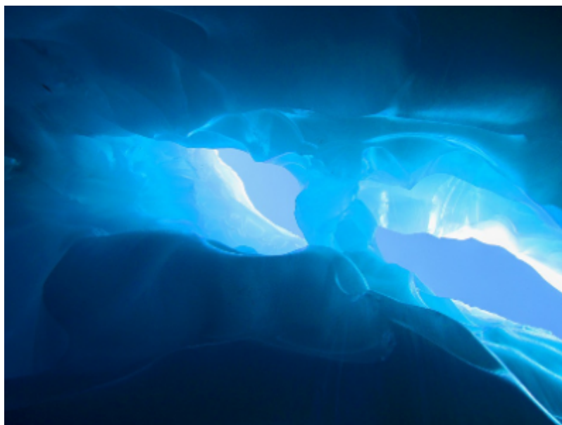
Figure 1. Couleurs bleutées dans une grotte glaciaire en raison de la diffusion de Rayleigh.

Pour les grandeurs comme la masse d'un contaminant, la chaleur ou la quantité de mouvement, l'existence d'une matière en agitation aux échelles microscopiques est nécessaire à leur diffusion. Au contraire, la lumière , elle, peut se propager dans le vide . Elle n'est alors soumise à aucune diffusion . Par contre, dans un milieu transparent, comme l'air ou la glace, dont la composition est non uniforme, une diffusion peut se produire . En langue anglaise, la distinction entre ce phénomène et la diffusion moléculaire est claire puisque ce phénomène est appelé scattering . La diffusion de la lumière dépend de la taille des objets diffuseurs, lire Les couleurs du ciel .