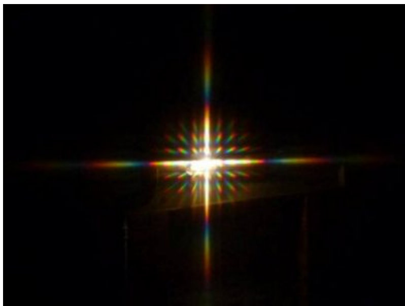
Figure3. Diffraction d'une lumière polychromatique par un orifice circulaire. La tache centrale est blanche en raison de la superposition de toutes les longueurs d'ondes. Les taches périphériques représentent tout le spectre des couleurs du visible, le décalage des diverses longueurs d'ondes étant de plus en plus grand lorsqu'on s'éloigne du centre.

Ces trois types de diffusion correspondent à différents modes d'interaction de la lumière avec l'objet diffuseur. Pour des objets grands par rapport à la longueur d'onde , on peut raisonner en termes de rayons lumineux , ce qui correspond à l'optique géométrique. A l'interface entre deux milieux, une partie de la lumière est réfléchi, et l'autre traverse l'interface avec une direction de propagation modifiée : c'est ce qu'on appelle la réfraction . Ce processus est observé dans un prisme comme celui de la vignette du focus Déviation de la lumière par un prisme (lien). Les différentes longueurs d'onde constituant la lumière blanche ont des angles de réfraction différents, ce qui conduit à la séparation des couleurs. Les gouttes d'eau ou les cristaux de glaces peuvent agir comme des prismes, ce qui conduit aux arcs en ciels (Lire Spectaculaires arcs en ciel ) ou autres phénomènes de halos atmosphériques (Lire Halos atmosphériques ). Dans les nuages les réflexions et réfractions sont multiples, ce qui brouille la séparation de couleurs, et restitue la couleur blanche de la lumière solaire.