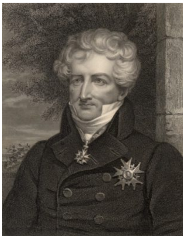
Figure 1. Portrait de Georges Cuvier par James Thomson par James Thomson (1789-1850).

L'image laissée par Georges Cuvier (1769 – 1832) dans l'opinion des biologistes actuels est complexe. Cuvier reste admiré, comme il l'était déjà de son vivant, pour avoir été l'un des —sinon le— meilleurs anatomistes de son temps, l'un des fondateurs de l'anatomie comparée et un contributeur majeur au renom et au développement du Muséum National d'Histoire Naturelle de Paris . Mais il fut aussi dénigré, sur le plan scientifique et sur le plan moral. Scientifique d'abord, pour avoir farouchement combattu les idées de deux ses collègues, son ancien ami Étienne Geoffroy Saint-Hilaire (1772 – 1844) et Jean-Baptiste de Lamarck (1744 – 1829).