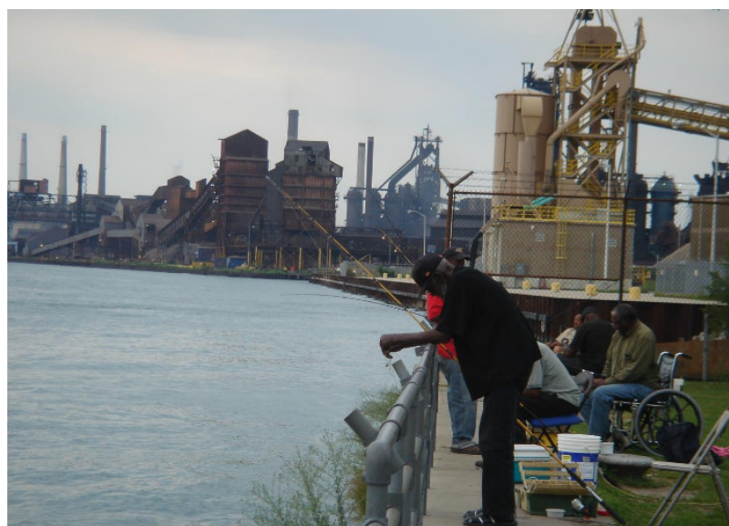
Figure 8. Le long de la rivière Detroit (Detroit)

La problématique des inégalités environnementales apparaît aux États-Unis à la fin des années 70 sous le nom de « justice environnementale », même si elle n'est pas née là-bas, comme le souligne Martinez-Allier (ibid.). Scientifiques, associations et habitants concernés dénoncent dans un premier temps les environnements pollués dans lesquels les populations noires-africaines sont confinées (Figure 8) et cherchent à les objectiver en démontrant scientifiquement la corrélation.