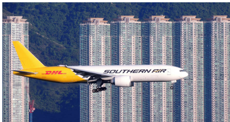
Figure 7. Atterrissage au milieu des buildings à Hong-Kong.

Comme nous l'avons vu, l'absence d'internalisation est source d'inégalités environnementales entre celui qui crée le dommage sur autrui et diminue son bien-être et celui qui en souffre. Or le rapport entre le pollué et le pollueur, entre le producteur de