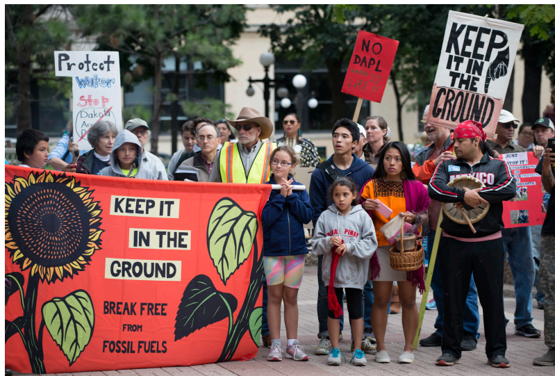
Figure 3. Manifestation demandant l'arrêt de la construction du pipeline devant passer en amont de la nation Sioux de Standing Rock (Dakota, USA). Avec la menace de leur approvisionnement en eau, la tribu affirme que le pipeline détruira les lieux de sépulture et les lieux sacrés.

Outre les pratiques d'aménagement, la politique menée à l'égard de catégories de populations minoritaires et/ou stigmatisée peut créer ou renforcer des inégalités environnementales : nous avons évoqué la ségrégation raciale aux États-Unis, mais le statut des Autochtones et les grands aménagements sur leur territoire ancestral produisent dans nombre de pays (États-Unis, Canada [12], Australie...) des inégalités environnementales conjuguant à la fois le faible accès au processus de décision, les impacts négatifs sur les sociétés autochtones et leurs pratiques, la faible voire l'absence de redistribution des revenus générés par l'équipement (Figure 3).