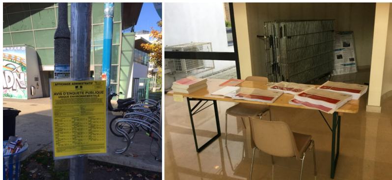
Figure 4. Photographies illustrant la publicisation officielle d'une enquête publique et le lieu de consultation des documents

Outre les pratiques d'aménagement, la politique menée à l'égard de catégories de populations minoritaires et/ou stigmatisée peut créer ou renforcer des inégalités environnementales : nous avons évoqué la ségrégation raciale aux États-Unis, mais le statut des Autochtones et les grands aménagements sur leur territoire ancestral produisent dans nombre de pays (États-Unis, Canada [12], Australie...) des inégalités environnementales conjuguant à la fois le faible accès au processus de décision, les impacts négatifs sur les sociétés autochtones et leurs pratiques, la faible voire l'absence de redistribution des revenus générés par l'équipement (Figure 3).