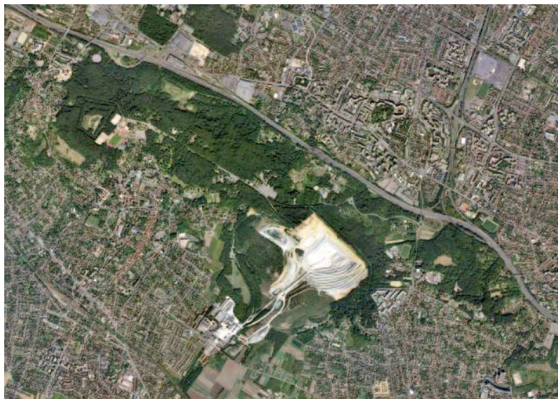
Figure 6. Vue aérienne de la carrière de gypse de Cormeilles-en-Parisis (Val-d'Oise) située au nord-ouest de Paris. Le gypse est la matière première pour fabriquer le plâtre.

Ces configurations possibles se croisent la plupart du temps et peuvent se lire à plusieurs échelles. Ainsi l'inégale contribution aux dommages environnementaux peut-elle se lire au niveau mondial par l'effet de la mondialisation des flux. En 2006, un bateau, le Probo Koala, déversait des substances très toxiques à Abidjan, faisant dix-sept morts et des dizaines de milliers de victimes. L'entreprise privée, négociant indépendant en produits pétroliers, qui l'affrétait n'a pu se débarrasser de ces déchets en Europe et s'est donc dirigé vers la Côte d'Ivoire au mépris du droit européen qui interdit l'exportation de certains types de déchets de l'UE vers les pays d'Afrique, des Caraïbes et du Pacifique .