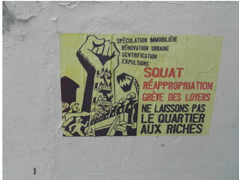
Figure 2. Affichette dénonçant les processus d'aménagement et d'éviction des populations pauvres (Paris, 20e)

De même, les pratiques d'aménagement [5] peuvent favoriser l'apparition et l'ancrage d'inégalités environnementales fortes. La ségrégation raciale dans le contexte états-unien a laissé une empreinte forte : des quartiers noirs-américains se distinguent des quartiers habités par des « blancs ». La ségrégation a prospéré par le biais de réglementations d'urbanisme et de choix d'investissements, dérivant d'une longue histoire de « marginalisation urbaine » et de racialisation des comportements (banquiers, urbanistes, collectivités locales, choix résidentiels des individus...)[6].