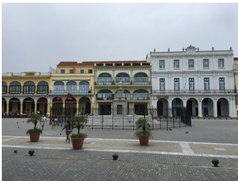
Figure 5. Fontaine de la Plaza Vieja (La Havane) ceinturée de grilles

l'accès différencié aux ressources « environnementales ». Il faut ici distinguer plusieurs configurations : (1) une accessibilité différente aux ressources nécessaires à la satisfaction des besoins élémentaires (eau propre, sols non pollués, air respirable...) et qui permettent de remplir des fonctions vitales (se nourrir sainement, se chauffer, se loger...) [16] et (2) une distribution et une accessibilité des aménités environnementales et des services écosystémiques différentes selon les individus et populations.