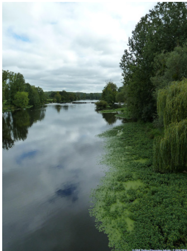
Figure 4. (La Vienne à Lussac-les-Châteaux (86) le 15/08/2011). Un développement des espèces invasives de plus en plus importants et contraignant dans le seaux de surface, dû très probablement à l'augmentation de la température de l'eau et aux apports de nutriments.

Par ailleurs, à qualité et quantité constantes des rejets anthropiques, l'effet de moindre dilution de la pollution, couplée à une remobilisation probable des polluants déjà présents dans les sédiments, conduira à une augmentation de la micropollution organique et minérale. La question de la qualité de la ressource pour l'alimentation en eau potable à partir d'eau de surface se posera également surtout lorsque cette ressource est la seule disponible. Quelles barrières peut-on envisager pour satisfaire l'augmentation probable dans les « eaux brutes » de certains paramètres de qualité de type parasites, cyanotoxines, carbone organique naturel (précurseur de sous-produits de désinfection toxiques), micropolluants, etc. ? Le développement de technologies énergivores et le recours plus systématique à des réactifs chimiques pour le traitement de l'eau à « potabiliser » sont bien sûr des solutions curatives à ces problèmes d'eau brute dégradée, mais à quels coûts et avec quels effets ?