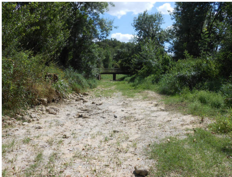
Figure 3. (La Dive du Sud à Couhé (86), le 30/07/2015). Des assecs de plus en plus fréquents et longs sous l'impact du changement climatique

Les éléments scientifiques actuels [4] montrent que le changement climatique, d'ores et déjà à l'œuvre en France, aura des conséquences importantes sur les ressources et alarmantes pour certaines zones géographiques particulièrement impactées. C'est le cas, par exemple, du grand sud-ouest de la France pour lequel des projections sur 2050 prévoient une diminution moyenne des débits naturels des cours d'eau de 20 à 40 % et une diminution de la recharge des nappes phréatiques de 30 à 55 %. On peut donc envisager des raréfactions de la ressource disponible, notamment lors d'épisodes de fortes chaleur et sécheresse et, par suite, une augmentation des conflits d'usage et des surconsommations d'eau potable (cf. § 2).