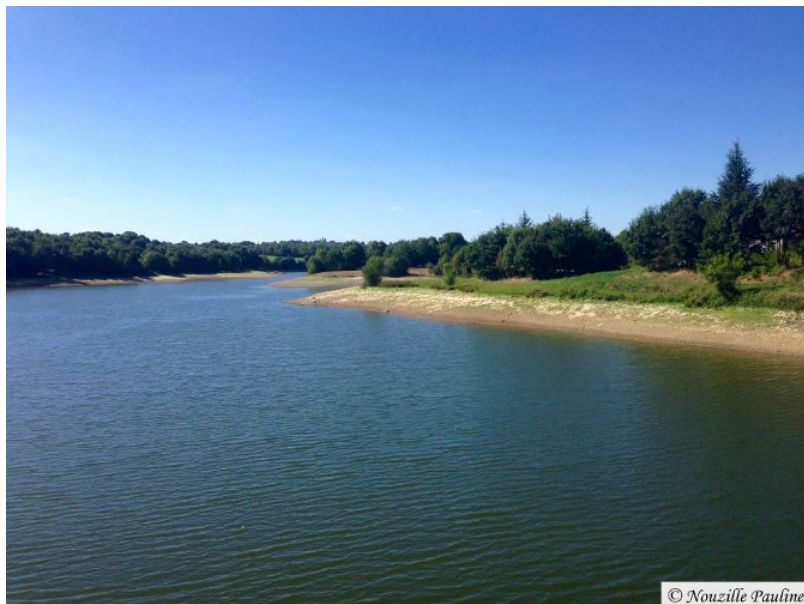
Figure 1. (Barrage de la Touche Poupard (79) le 21/08/2016). C'est à partir des eaux de retenue que la production d'eau potable est la plus délicate.

Ce prélèvement de 5,4 km 3 pour produire de l'eau potable destinée à 67 millions d'habitants correspond à une moyenne de 80,6 m 3 par habitant et par an (ou 221 litres par jour). En 2012, la consommation moyenne est de 54 m 3 /hab./an. Elle est plus élevée en milieu urbain qu'en milieu rural. Supérieure dans un passé récent, cette consommation moyenne a diminué progressivement à partir des années 1990, notamment par souci de réduction de la facture d'eau, mais aussi par changement de comportement. La différence entre le prélèvement dans la ressource et la consommation domestique (au robinet du consommateur) a plusieurs origines. La perte d'eau en réseau de distribution, relativement constante depuis une quinzaine d'années, est estimée à environ 15,6 m 3 par habitant et par an. Les autres pertes (en usine de production), les consommations par le secteur tertiaire, le secteur public et le secteur industriel (consommant de l'eau potable) expliquent la différence restante.