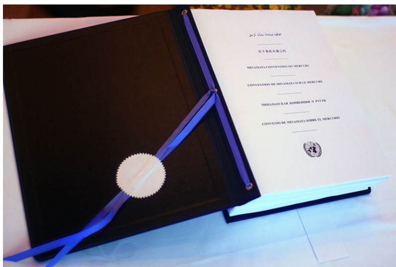
Figure 3. La Convention de Minamata sur le mercure, prête à être signée

Les négociations de la Convention de Minamata ont officiellement commencé avec la première réunion du Comité de Négociation Intergouvernemental (CNI), mandaté par la Conférence Diplomatique, qui a eu lieu du 7 au 11 juin 2010 à Stockholm. A l'issue de cette réunion, un texte a été arrêté pour servir de base aux négociations futures. Il y a eu cinq réunions du CNI au cours desquelles les États débattaient pour modifier le texte de base et arriver à un consensus.