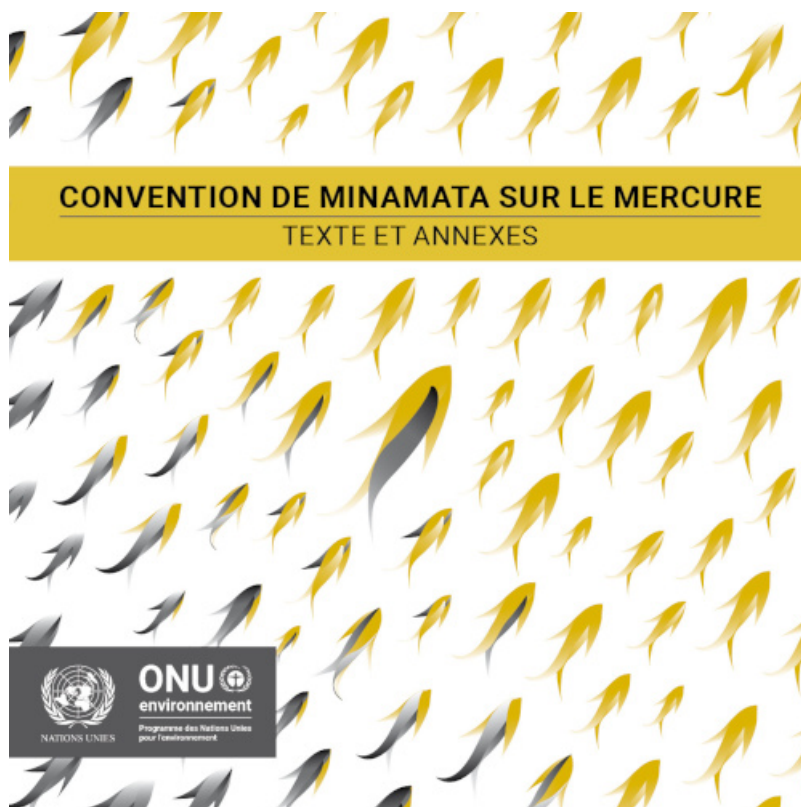
Figure 2. La Convention de Minamata, édition élaborée pour la COP-1

Le mercure est un élément naturel qui peut se révéler dangereux pour la santé et pour l'environnement (lire " Le mercure, le poissons et les chercheurs d'or ") [1]. C'est la raison pour laquelle son utilisation fait l'objet de restrictions et d'interdictions dans de nombreux pays. Par exemple, les amalgames dentaires sont interdits dans l'Union Européenne pour les mineurs de moins de quinze ans et les femmes enceintes, particulièrement vulnérables aux effets du mercure [2].