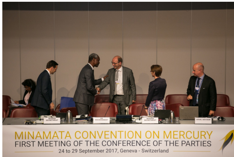
Figure 5. Marc Chardonens, Director, Federal Office for the Environment, Switzerland, is welcomed onto the podium after being elected COP1 President

La Convention de Minamata , comme la grande majorité des conventions environnementales, établit une Conférence des Parties (COP) (Figure 5). Il s'agit d'une assemblée qui prend des décisions à intervalles réguliers, principalement sur la mise en œuvre de la Convention . Seuls les États qui se sont engagés à respecter la Convention disposent d'un droit de vote et les décisions sont prises en général par consensus. Les autres États, les ONG et le secteur privés sont cependant admis à titre d'observateurs et peuvent prendre la parole durant les négociations, sans bénéficier d'un droit de vote. Les décisions rendues peuvent aussi concerner des aspects qui n'ont pas pu être réglés au moment de la signature de la convention, faute de consensus, ou de temps durant les réunions de négociations.