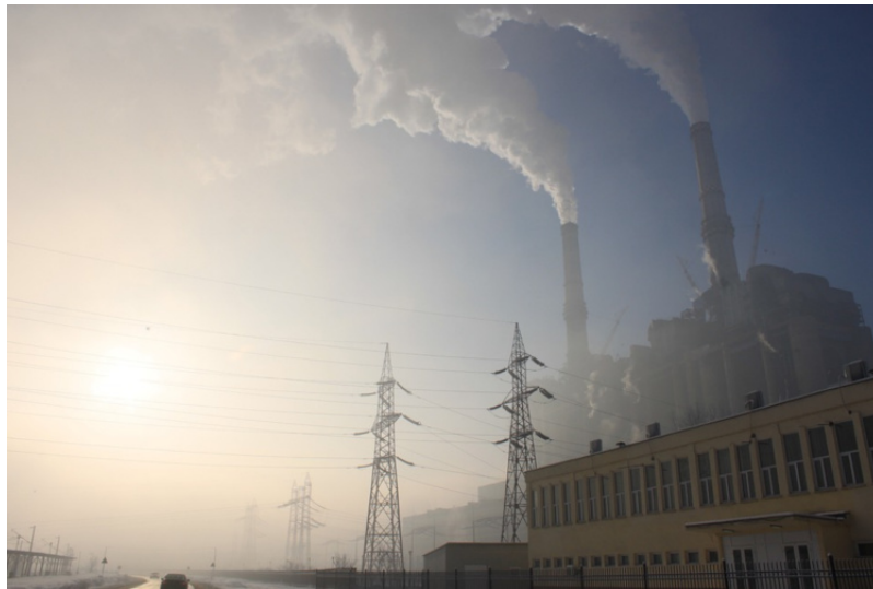
Figure 4. Les principales industries de la ville et de la périphérie de Huolin Gol (charbon, énergie et chimie) ont tellement pollué les prairies que les troupeaux ne peuvent plus y paître. La collectivité locale a installé des sculptures à la place des bêtes.

La Convention de Minamata intègre des mesures juridiquement contraignantes assez fortes. Par exemple, du moment où elle entre en vigueur, aucune nouvelle activité d'extraction minière de mercure ne peut être entreprise. Les activités d'extraction qui existaient déjà peuvent se poursuivre, mais seulement pendant une durée limitée de quinze ans [8]. On espère que dans quelques années plus aucune mine de mercure ne sera en activité.