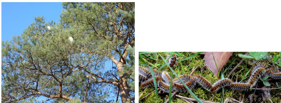
Figure 10. Processionnaires du Pin. À gauche, Nids de chenilles processionnaires dans un pin sylvestre. ; À droite, Ligne de chenilles processionnaires dans la forêt.. Dotées d'une grande fécondité (pour les papillons adultes) et d'un bon appétit pour les aiguilles de pin (pour les chenilles), les populations de processionnaires du pin ( Thaumetopoea pityocampa ) profitent du changement climatique pour accroître leur aire de répartition en altitude et vers le Nord.

le déplacement plus ou moins rapide d'espèces ' r ' et ' K ' vers des conditions de vie plus favorables, en réponse au réchauffement climatique – par exemple, déplacement de scolytes (coléoptères xylophages), tordeuses (chenilles phytophages) et autres insectes dits 'ravageurs des forêts', vers les pôles et en altitude.