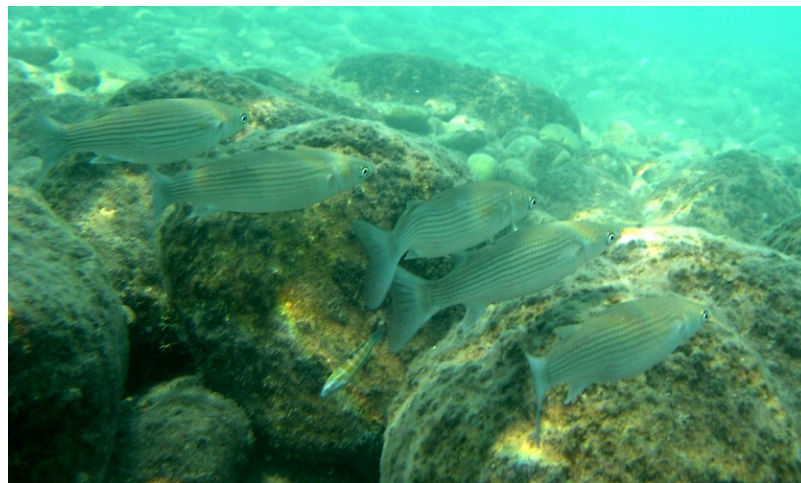
Figure 1. Peuplant estuaires, lagunes et littoraux méditerranéens, les mullets sauteurs ( Liza saliens ) tolèrent de larges fluctuations de salinité de l'eau.

Selon Hutchinson [2], toute espèce ou population peut être caractérisée par sa « niche écologique », définie comme la « place » occupée par cette espèce dans un écosystème et l'ensemble de ses exigences physiques, chimiques et biologiques à un instant donné. Produits de la sélection naturelle, ces exigences écologiques évoluent au fil des générations, avec la physiologie et le comportement des espèces. Ainsi la « largeur » de la niche écologique de chaque espèce est adaptée aux variations des conditions de vie habituellement rencontrées par les individus, dans le temps et dans l'espace (Lire Focus De la construction de niche à la destruction d'écosystèmes ).