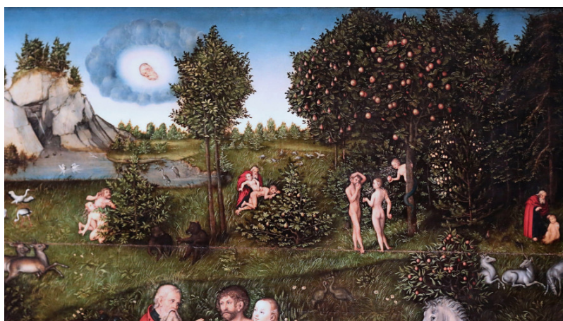
Figure 3. Le Paradis. Peinture de Cranach le vieux, 1530.

L' étymologie est souvent un excellent moyen d'éclairer toute la profondeur d'un terme ; celui de « nature » échappe pourtant en bonne part à cette approche. Le mot est formé à partir du verbe latin nascor , qui signifie « naître », ici dans une forme verbale appelée supin, forme qui peut servir à construire le participe futur (ce qui ne semble pas être le cas ici, on n'en connaît en tout cas pas d'usage dans ce sens) ou, comme les autres mots français en -ure (culture, température, ossature) désigne une manière d'être. Ce serait donc, étymologiquement, la manière dont on est né, une sorte de caractère primordial – ce qui exclut alors tout usage absolu (effectivement absents pendant toute la période pré-classique). A la période classique, où les jeunes Romains de bonne famille vont parfaire leur éducation intellectuelle en Grèce, ce mot est choisi pour traduire le grec phusis , et va en fait se calquer sur son emploi. Or, la phusis est l'un des concepts les plus complexes de la philosophie grecque, à la fois omniprésent (presque tous les grands ouvrages des philosophes présocratiques sont titrés Peri phuseos , ce concept apparaissant comme l'objet de toute entreprise scientifique ou philosophique), mais avec un sens et un usage qui varient énormément d'un auteur à l'autre, ou plus précisément d'une école philosophique à l'autre. A la fin de l'apogée de la Grèce, Aristote tente un catalogue de ces sens, et en énumère quatre principaux [3] :