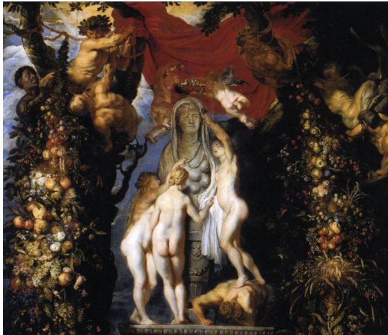
Figure 4. La nature ornant les trois grâces (partie haute). Tableau de Rubens et de Bruegel l'ancien. La statue au centre représente la « Terre Mère », figure maternelle d'Isis traditionnellement représentée avec de nombreux seins sur la poitrine.

Ce n'est qu'à la Renaissance que la nature fait son grand retour dans le paysage intellectuel européen, suite à la redécouverte des textes antiques, mais sans réelle théorisation de son sens : la nature est alors vue soit comme l'ensemble de la création (incluant l'Homme ou pas), l'ensemble des forces physiques qui règlent le monde (« lois naturelles »), ou même une sorte de puissance abstraite du réel, parfois allégorisée en « Nature » avec majuscule, sorte d'émissaire terrestre de la volonté divine, voire de pendant féminin et bienveillant du Père tout-puissant (la nature était déjà allégorisée à la fin de l'Antiquité sous la figure maternelle d'Isis, qui sera plus tard laïcisée dans l'idée de « mère Nature » [5]) (Figure 4). Le fait que Platon, méta-physicien par excellence, ne semble pas s'être intéressé à ce concept trop basement terrestre, alors que les philosophes l'érigèrent progressivement pendant l'âge classique en arbitre en chef de ce qui est ou n'est pas un concept philosophique, a sans doute participé par la suite à le faire négliger par l'essentiel de la tradition académique européenne, et ce jusqu'à nos jours.