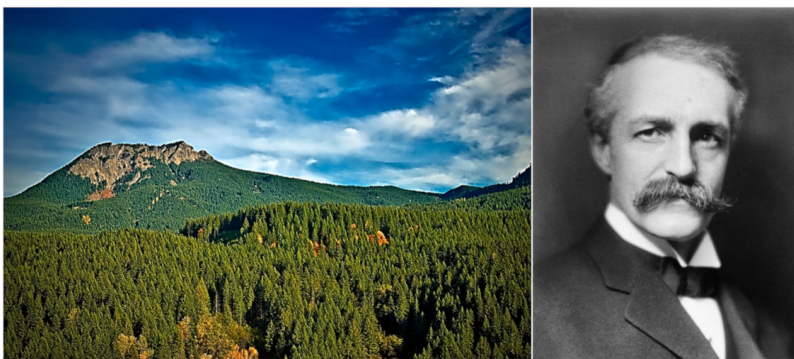
Figure 5. Pinchot National Forest (Washington, USA) et portrait de Gifford Pinchot

Historiquement, les sociétés humaines ont d'abord protégé des « ressources » naturelles (bois, gibier, animaux « utiles »...) [9], la « nature » elle-même représentant une instance trop abstraite et trop massive pour faire l'objet d'une action humaine directe. Dès le néolithique, les groupes humains sédentaires se mettent donc à épargner une partie de leurs ressources pour en assurer la reproduction et la permanence. Cette gestion sera plus tard confiée à des corporations spécialisées, comme en France l'administration des Eaux & Forêts, créée par Philippe le Bel en 1291, avant d'être modernisée par Colbert en 1669. En Amérique, c'est Gifford Pinchot (formé à l'école de Nancy) qui fut le grand protecteur des ressources naturelles à la fin du XIX e siècle, face à l'appétit de plus en plus féroce des exploitants (Figure 5).