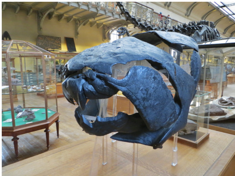
Figure 8. Fossile de placoderme du Dévonien (MNHN).

L'idée de nature a connu une révolution au XVIII e siècle : les occidentaux terminent alors de cartographier l'ensemble de la