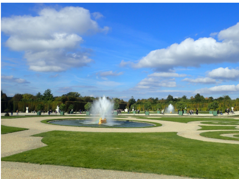
Figure 6. Parc du château de Versailles, illustrant le concept de locus amoenus .