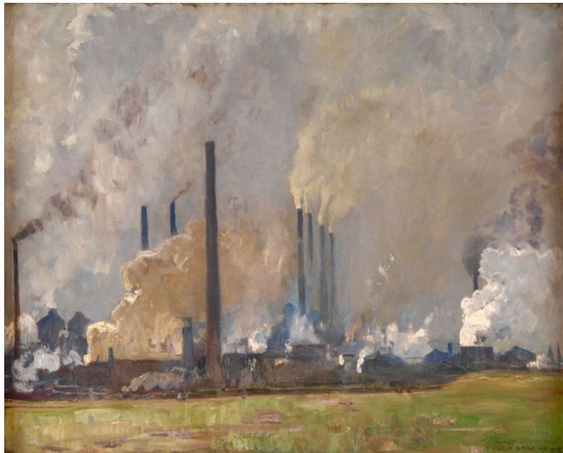
Figure 7. Les premières pollutions de grande importance émergent avec la révolution industrielle. [Source : Eugen Bracht, Public domain, via Wikimedia Commons]

La protection de cette nature-cadre agréable et esthétique est connue sous le nom particulier d' environnementalisme , terme qui contient très bien sa dimension anthropocentrique, et qu'il convient de distinguer de l'écologisme. Il s'agit en fait avant tout d'une protection des humains, tout d'abord contre la nature sauvage puis rapidement contre les nuisances humaines elles-mêmes : c'est à ce titre qu'apparaissent diverses réglementations de ces nuisances, qu'il s'agisse de la création d'égouts et de latrines dès l'Antiquité, puis surtout de mesures plus importantes avec la Révolution Industrielle (Figure 7). On peut citer par exemple en France le Décret impérial du 15 octobre 1810 relatif « aux Manufactures et Ateliers qui répandent une odeur insalubre ou incommode », et en Angleterre la création en 1815 de la Commons Open Spaces & Footpaths preservation society . Une grande partie des législations environnementales modernes entrent dans ce cadre, et protègent une « nature » bien spécifique, qui est la nature domestiquée – et n'en est pas forcément moins légitime pour autant.