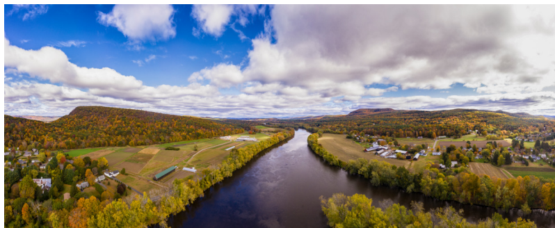
Figure 11. La Mont Toby Farm (Sunderland, MA, USA) travaille en étroite collaboration avec l'USDA (Département de l'Agriculture) et la NRCS (Ressources naturelles et conservation) pour préserver l'environnement. Ce genre de modèle est encore exceptionnel en Amérique, contrairement à l'Europe.

L'échelle change alors radicalement à la fin du XX e siècle : il s'agit à présent de protéger non plus des objets mais des phénomènes, à une échelle toujours grandissante, et pour finir planétaire . L'idée même de réserve trouve ici ses limites, puisque ces flux et phénomènes les débordent largement, et c'est donc toute l'organisation des sociétés humaines qui est à revoir , car cette protection-là ne peut plus se contenter d'une poignée de zones désertiques ou montagneuses sanctuarisées parce que de toute façon improductives. Le climat, la circulation de l'eau, l'équilibre de la biodiversité dépendent en effet moins du parc de Yellowstone ou de la Monument Valley que de l'usage des sols fertiles des grandes plaines fluviales où se concentrent précisément toutes les activités humaines, et la séparation étanche de la nature et des humains apparaît bien illusoire [14] (Figure 11).