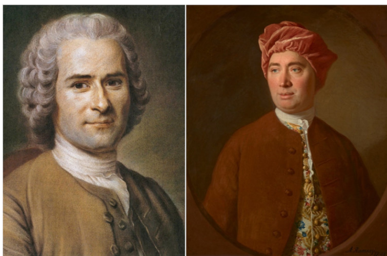
Figure 2. Portraits : à gauche, Jean-Jacques Rousseau (1712-1778), à droite, David Hume (1711-1776).

Ainsi, la « nature » est essentiellement demeuré un terme « vulgaire » dans les langues européennes, et n'a presque jamais fait l'objet d'une théorisation académique avancée, mis à part dans l'expression « nature humaine », qui eut son heure de gloire au XVIIIe siècle sous l'impulsion de David Hume ou Jean-Jacques Rousseau [1] (Figure 2).