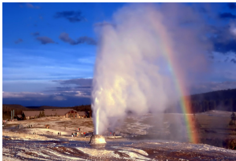
Figure 9. Arc-en-ciel au-dessus d'un geyser dans le parc national de Yellowstone, Wyoming (USA).

planète , qui semble d'un coup étonnamment petite. En même temps, les explorateurs donnent une idée de la répartition spatiale des différentes espèces, ce qui permet de comprendre que certaines d'entre elles ont bel et bien irrémédiablement disparu, alors qu'on pouvait jusque-là toujours leur imaginer des poches résiduelles (y compris pour les espèces fossiles, Figure 8). On prend donc conscience que Dieu ne semble pas « re-crée » ses créations si l'Homme les détruit, et le rapport à la nature change alors brutalement avec la première génération romantique : la nature passe alors de mystérieuse mère d'abondance infinie à fragile cadre de la violente histoire humaine .