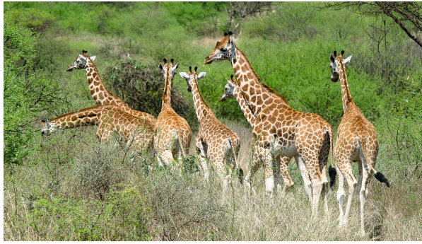
Figure 3. Population de girafes de Rothschild (Giraffa camelopardalis rothschildi) du lac Baringo (Kenya). Selon la vision de Lamarck, les girafes, vivant dans des régions arides, ont étiré leurs pattes antérieures et leur cou afin d'atteindre le feuillage des arbres. Ces efforts auraient entraîné un allongement transmis de génération en génération et s'accroissant au fil du temps. Selon Darwin, les girafes ont naturellement des pattes antérieures et un cou plus ou moins longs suite à des variations héréditaires fortuites. Les plus grandes vont être avantagées pour se nourrir car elles seront moins soumises à la concurrence des autres espèces. Elles vont donc vivre plus longtemps et auront une descendance plus nombreuse qui aura hérité de cette grande taille. Cette pression sélective va se poursuivre au cours des générations successives et progressivement, l'avant-train et le cou des girafes vont s'allonger. La diversité biologique d'une population repose sur les mutations génétiques naturelles qui vont soit apporter un désavantage et seront donc éliminés, soit apporter un avantage qui va aider à la survie et au développement de l'espèce.

C'est ainsi qu'en France, l'idée même d'évolution n'a été acceptée par la plupart des biologistes qu'avec un demi-siècle de retard et, quand elle l'a été, c'est surtout le lamarckisme qui a prévalu, jusque vers le milieu du siècle dernier. Jean-Baptiste Lamarck , très grand naturaliste français, a été le premier à proposer une théorie cohérente de l'évolution des espèces vivantes (le « transformisme »). Mais quant au mécanisme, il postulait une influence prépondérante et directe du milieu (Figure 3). Pour lui, les « circonstances », les « besoins », les « efforts » (au moins pour les animaux), modifiaient les organismes vivants pour améliorer leur adaptation et ces modifications étaient transmises aux descendants. C'était évidemment beaucoup plus conforme à la bonne morale sociale : on s'améliore en faisant des efforts et on transmet cette amélioration à nos enfants, c'est merveilleux ! Sauf que c'est en contradiction avec toutes les connaissances scientifiques acquises depuis plus d'un siècle (Lire Lamarck et Darwin : deux visions divergentes du monde vivant ).