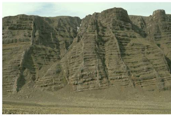
Figure 2. Dykes en Islande : Une fois le magma refroidi, les dykes volcaniques correspondent à de grandes structures planes dont la géométrie témoigne de l'orientation des directions principales locales de la contrainte lors de la mise en place du magma..

Du fait qu'une fracture hydraulique se propage perpendiculairement à la contrainte principale minimum dans le massif, sa géométrie à grande échelle est contrôlée par celle des variations de contrainte principale minimum dans le massif. Par exemple la figure 2 montre que les dykes volcaniques, une fois le magma refroidi, correspondent à de grandes structures planes qui renseignent sur l'état de contrainte locale.