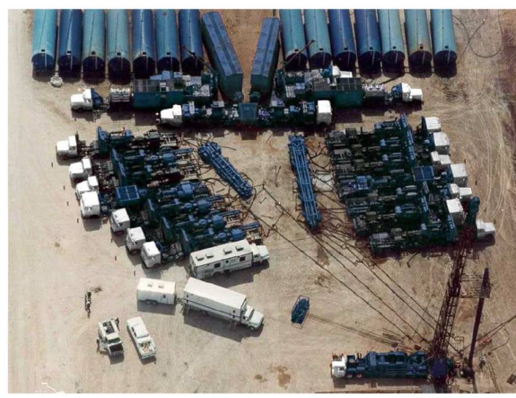
Figure 3. Une opération de fracturation hydraulique telle que menée pour une exploitation d'hydrocarbures non conventionnels. On voit dans le fond les citernes d'eau prêtes pour une injection d'environ 500 m 3 . La tête de forage est visible dans le coin de l'image en bas à droite. Les camions devant les citernes assurent la préparation du mélange fluide-sable qui est injecté par les deux rangées de pompes montées sur camion. Chaque pompe a une puissance d'environ 500 ch.

Mais si l'on se contente d'injecter de l'eau, à l'arrêt de l'injection la pression chute et la fracture se referme sans aucun effet sur la production d'hydrocarbure. Dans la pratique, la technique consiste à amorcer la fracture avec un liquide standard (boue de forage ou eau), puis à injecter un liquide visqueux dans lequel on a mis du sable en suspension (figure 3) (voir rubrique Les sables, de cette encyclopédie) (lien : Les sables). A la fin de l'injection, lorsque la pression chute et que la fracture se referme, le sable reste en place et assure ainsi un drain efficace pour la production d'hydrocarbure. L'opération est réalisée par quelques opérateurs spécialisés qui ont appris à maîtriser la viscosité des liquides utilisés pour mettre le sable en suspension. En effet il faut que cette viscosité soit élevée pour que la densité de sable en suspension dans le fluide soit la plus grande possible, mais il faut qu'elle soit la plus faible possible pour ne pas gêner la production d'hydrocarbures à la fin des opérations de fracturation.